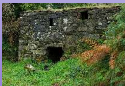
"Muiño do Medio" no primeiro tramo da senda