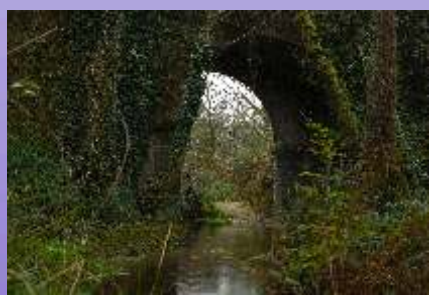
Río Becerreira, chegando a ponte do Carneiro