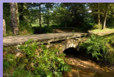
Ponte das Febres, no enlace ao P.N. Monte Aloia