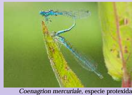
Coenagrion mercuriale , especie protexida

A auga é o elemento que define esta ruta. A súa presenza acompañará a nosa andaina, e verémola percorrer paseniño polo gran entramado de regatos, ríos, brañas, gándaras e regos. No primeiro tramo un conxunto de vellos muiños agarda o intre de voltar a traballar coa axuda das augas do pequeno regato... Éstas augas xúntanse máis adiante ás do río Becerreira, do mesmo xeito que as filtradas pola braña da "rega da lama", espazo de gran importancia ecolóxica. O Becerreira, tamén coñecido como río Tinto, lévanos até o río que formou a depresión sobre o que se asenta este conxunto de hábitats de singular valor, o Louro. O bosque asolagado que agarda neste treito do camiño semella unha paisaxe encantada saída dun conto. Máis adiante chegamos a un lugar antano ferido polo home - antigo vertedeiro en restauración-, onde a natureza está a recuperar o que lle foi sustraído. Xa por último, e seguindo as augas que sucán os regos, chegamos aos campos de cultivo e prados, lugares que tamén axudan ao mantemento dunha interesante biodiversidade.