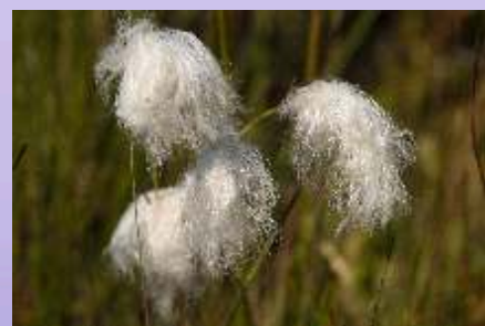
Xunca de algodón, habitante de brañas e turbeiras